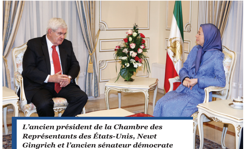
L'ancien président de la Chambre des Représentants des États-Unis, Newt Gingrich et l'ancien sénateur démocrate Robert Torricelli ont été reçus par Maryam Radjavi, la présidente élue du Conseil national de la Résistance iranienne.